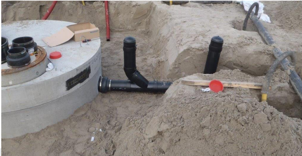
Foto: Voorbeeld van voorzieningen voor controle van de bedrijfsriolering op waterdichtheid. Aansluiting van de bedrijfsriolering (hdpe) op de prefab betonnen slibvangput.

Om het beproeven van de dichtheid te kunnen uitvoeren, monteert de aannemer in de toevoerleiding naar de slibvangput, kort voor de aansluiting daarop, een T-stuk van 90° en/of een T-stuk van 45°, of een andere installatie waarmee leidinggedeelten eenvoudig kunnen worden afgesloten en beproefd.